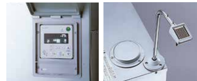
本体前面に開閉式の操作部扉を設けることで、リモコンの操作がしやすくなりました。 本体上部に、降雪センサーの取付が可能に。施工時間もさらにスピードアップ。

最小奥行き24cmとスリムでスマート。ボイラーハウス(キャビネット)とボイラーを一体化した「コンパクトパッケージ」をはじめ、種類も豊富にラインナップ。設置するにあたって余分な場所を必要としない、うれしい省スペース設計です。